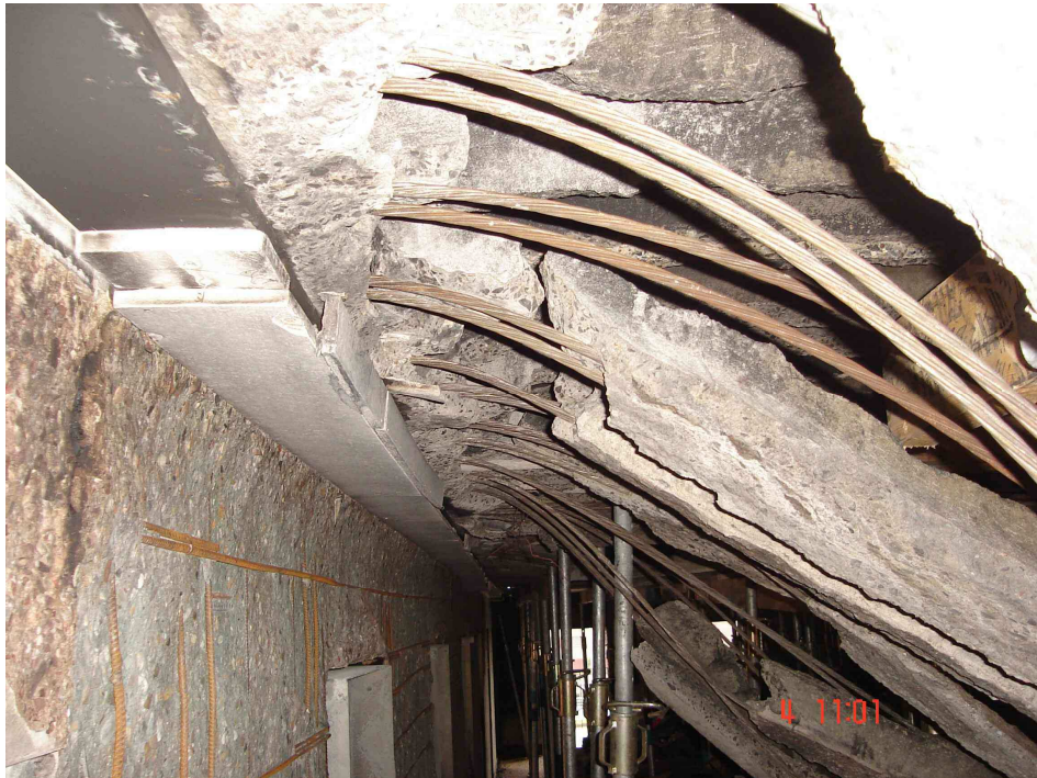
Foto: een bezweken betonconstructie door brand

Controle Bouwbesluit 2012 t.a.v. constructieve (brand)veiligheid van een woongebouw is hoog geprioriteerd. Als een woongebouw instort is het risico groot. Met name de negatieve effecten veiligheid en imago scoren hier hoog. Op het gebied van naleeftekort is de spontane naleving slecht en is de kans dat er regels niet worden nageleefd groot. Deze scores resulteren gezamenlijk in een hoge prioriteit. Actief optreden is noodzakelijk om (verdere) instorting te voorkomen.