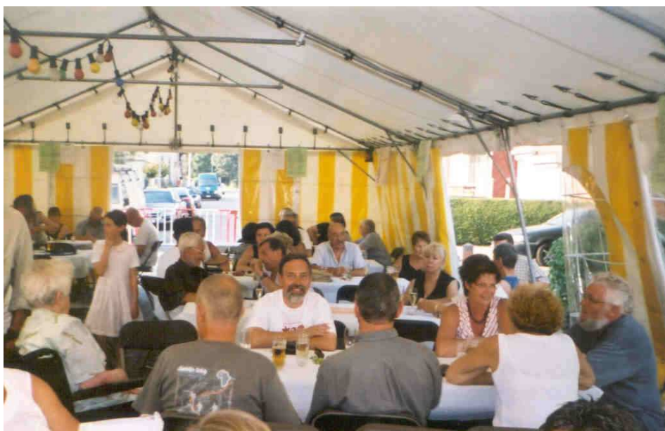
Foto: een straatfeest

Brandveiligheid op kleine evenementen, zoals een straatfeest, heeft een laag risico. Als er iets gebeurt dan zijn de negatieve effecten vaak gering, omdat de evenementen vaak buiten zijn. Het naleeftekort is daarentegen wel slecht. Zonder overheidshandelen (voorlichting, toezicht en corrigerend optreden) kan men de grenzen verleggen. Dit heeft tot gevolg dat er een toename zal zijn van overtredingen. Het steekproefsgewijs controleren op deze handhavingstaak houdt het naleefgedrag op peil.