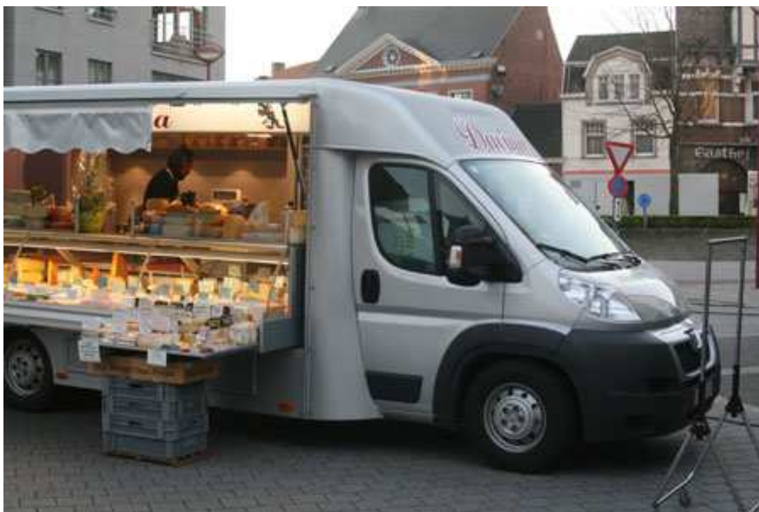
Foto: een standplaats

Het is verboden zonder toestemming een standplaats in te nemen. Over het algemeen weet een standplaatshouder dit. Een kaasboer zal niet zomaar op de hoek van een straat zijn wagen neerzetten om zijn waar te verkopen. Het naleefgedrag van deze regel is dan ook relatief hoog. Ook blijkt uit ervaringscijfers dat de overtredingskans laag is. Het risico van een illegale standplaats is ook niet erg hoog. Handhaving of optreden tegen deze overtreding heeft dan ook een lage prioriteit. In dit geval wordt er alleen op basis van klachten opgetreden.